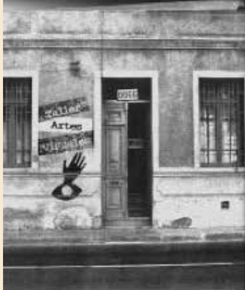
Taller de Artes Visuales (TAV)