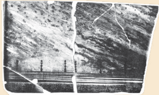
“La Moneda” Litografía Nemesio Antúnez

Durante el periodo de 1970-73 la actividad artística y cultural estará orientada a la investigación, la difusión, la participación y la apertura al arte de otros países, en especial latinoamericanos. En 1970 Nemesio Antúnez, como director del Museo Nacional de Bellas Artes, organiza la IV Bienal Americana del Grabado en la que participan 11 países y 62 artistas chilenos. Paralelamente, se muestran por primera vez las estampas grabadas de la Lira Popular y la obra de Carlos Hermosilla, a quien se le reconocerá su larga y fructífera trayectoria, la más antigua en este país de un grabador con nombre y apellidos. En esos tres años, el museo acogerá importantes muestras, abrirá sus puertas a los jóvenes y alentará la participación de sectores hasta entonces marginados.