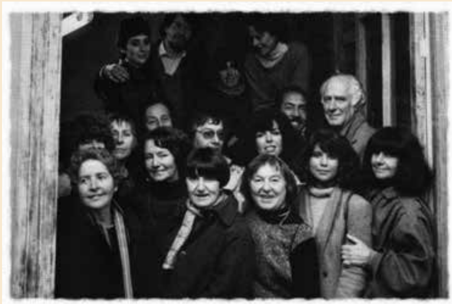
Refundación Taller 99, 1985.

En más de siglo y medio de historia en Chile, el grabado ha dado innumerables frutos, escuelas, corrientes, estilos y destacados artistas que -de múltiples maneras- fueron reflejando la identidad de un país, de un continente y del tiempo que les tocó vivir. Las nuevas generaciones están grabando ahora su propia historia y a ellas les tocará contarla.