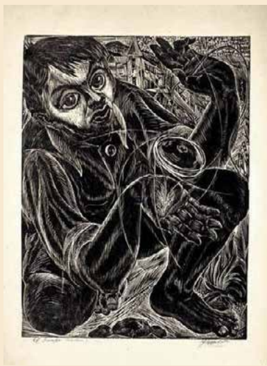
“El niño de las bolas” Xilografía de Carlos Hermosilla

Durante las primeras décadas del siglo XX, se producirá un considerable aumento de la población y urbanización en Santiago, así como la conquista de los cerros de Valparaíso y Viña del Mar. El índice de alfabetización llegará al 50% de la población, en 1920. Esta masa de potenciales lectores favorecerá una impresionante expansión de la prensa y de obreros tipógrafos; así como el incremento de periódicos obreros socialistas y anarquistas. Tanto en Santiago como en Valparaíso, surgen numerosos talleres y establecimientos fabriles. Las migraciones hacia estas dos grandes ciudades traerán consigo la proliferación de barrios obreros, ranchos, conventillos y cités, donde las condiciones insalubres van a propiciar varias epidemias y una elevada mortalidad infantil.