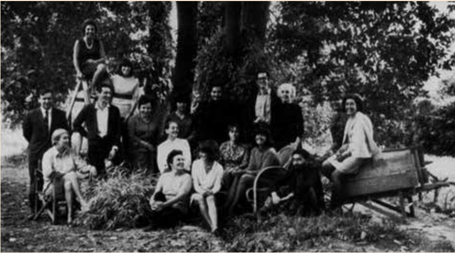
Miembros fundadores del Taller 99