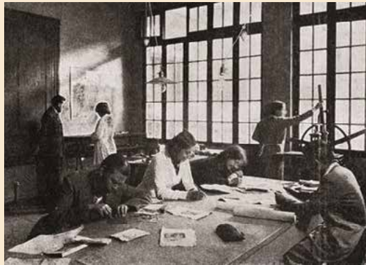
Escuela de Artes Aplicadas, Universidad de Chile.