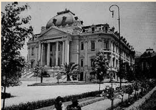
Escuela de BBAA Universidad de Chile (Parque Forestal)

Entre los años 50 y 60, Chile no va a permanecer al margen de las tendencias y movimientos artísticos de Europa y EEUU (arte concreto, informalismo, arte pobre, hard pop). Por aquellos años, se enfrentarán dos planteamientos teóricos diferentes: el grupo Forma y Espacio , con la abstracción geométrica; y el grupo Signo , adscrito al informalismo que, poco a