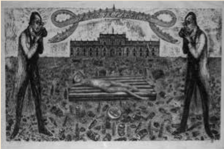
“Venus en Paradise” Guillermo Frommer